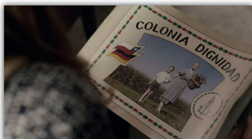
Colonia (2015): 00:24:03

el sello de la Sociedad Benefactora y Educacional Dignidad (la personalidad jurídica de la Colonia Dignidad en Chile).