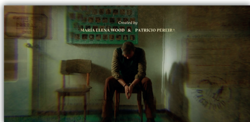
Dignidad (2019/2020), E1, 00:05:02