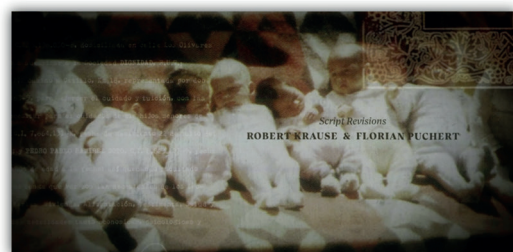
Dignidad (2019/2020) E1, 00:04:41