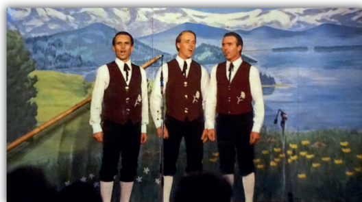
Dignidad: 33 años de entrega (1994)