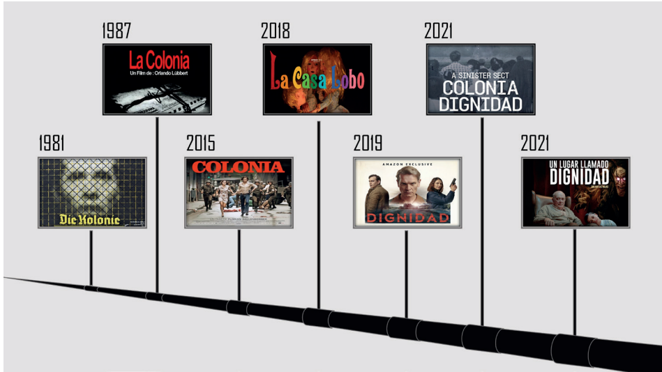
Figura. 1 Colonia Dignidad en el ámbito del entretenimiento (1981–2021).