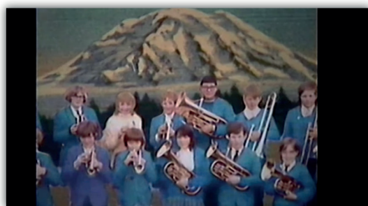
La casa lobo (2018)