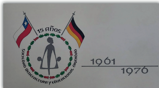
15 años SBED, 1976